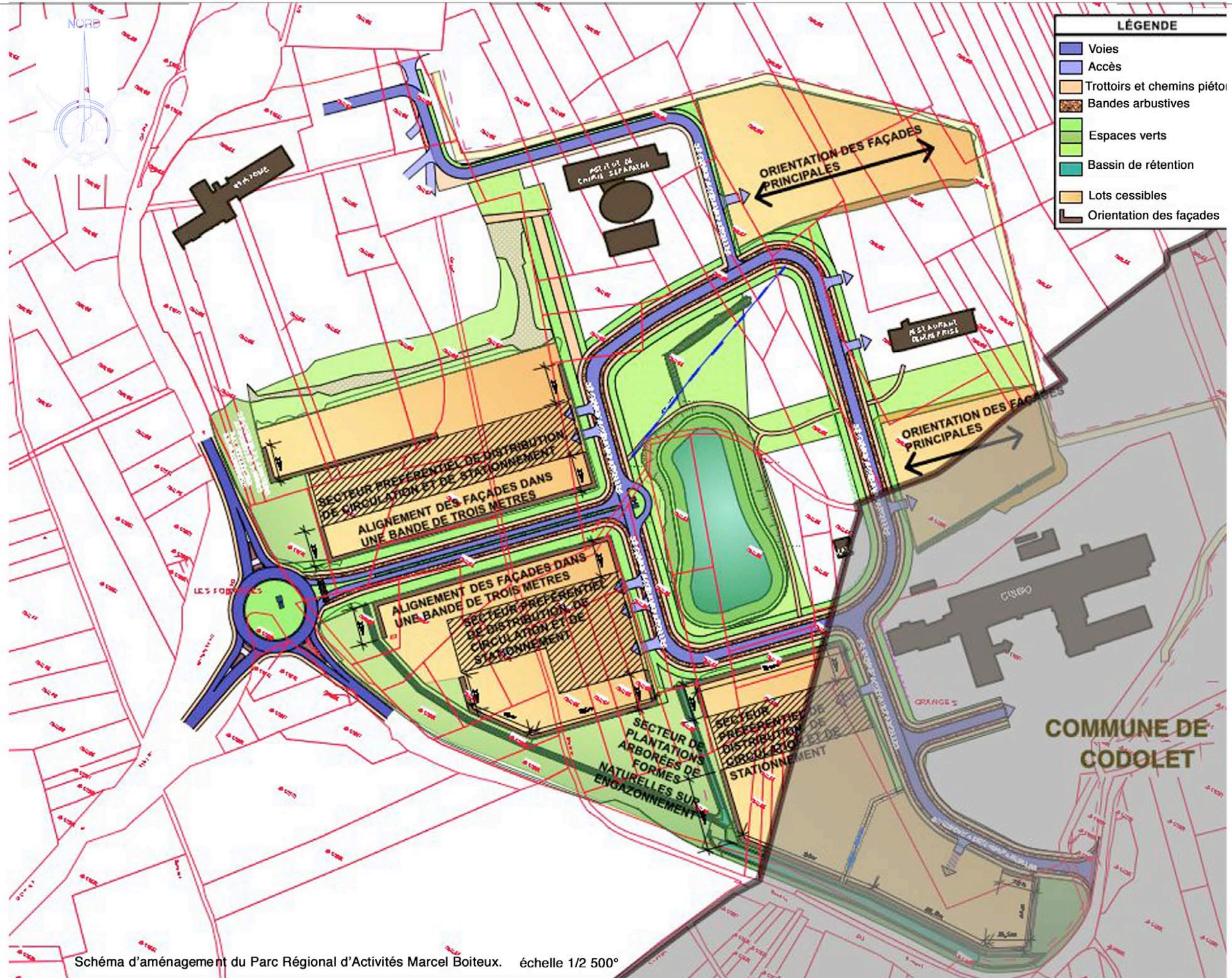
Schéma d'aménagement du Parc Régional d'Activités Marcel Boiteux. échelle 1/2 500°